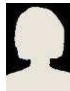
PL Sabine Kesting