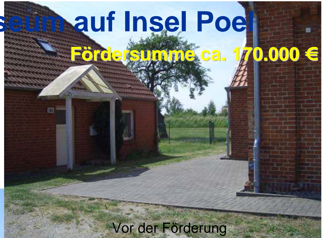
Vor der Förderung